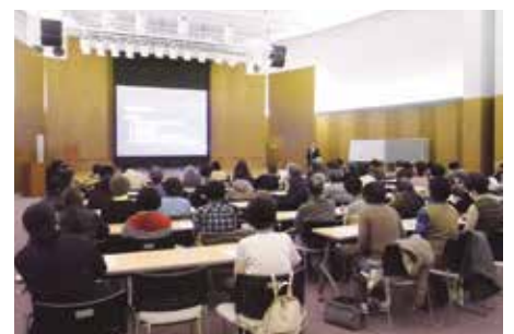
角田副院長による 市民公開講座の様子