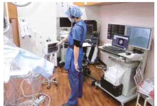
心臓カテーテル室業務