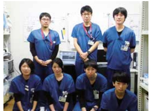
臨床工学科スタッフ

臨床工学技士はあまり耳にしない職種かもしれませんが、医療の進歩に伴って、医療機器の高度化・複雑化が進んでいく中で、ますますその活躍が期待されています。