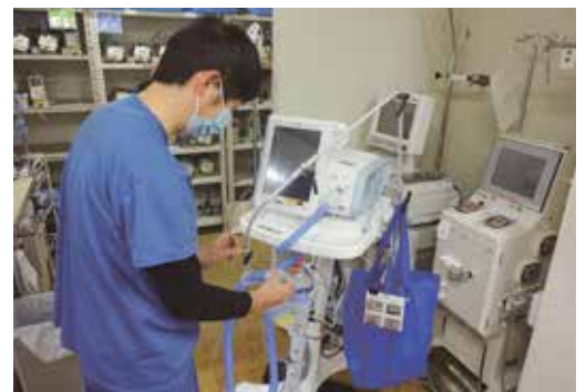
医療機器管理業務