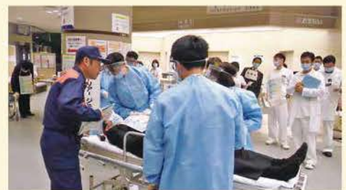
救急搬送に対応するスタッフ

災害や事故の発生時期や規模は予測できません。緊急時にも十分な医療を提供できるように、今後も訓練を行っていきます。