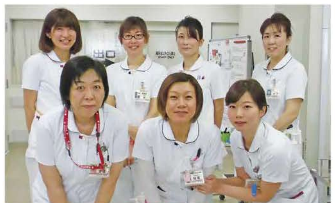
スタッフ集合写真