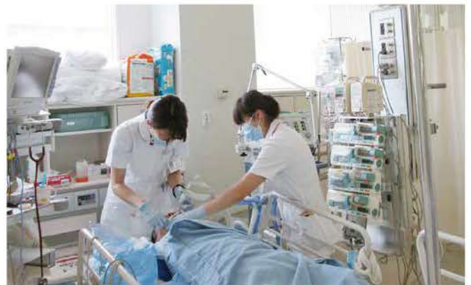
患者さん観察中の様子