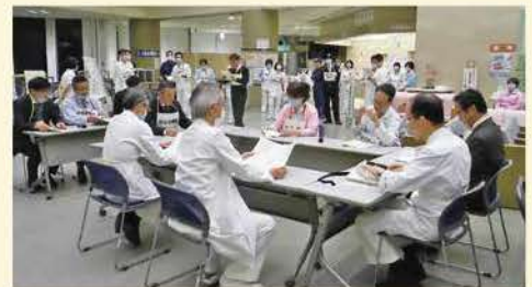
対策本部での情報確認