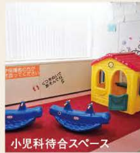
いのうえ ともこ 井上 友子

平成20年に関西医科大学を卒業し、その後当院と神戸大学付属病院で初期研修後、当院消化器内科医として勤務しています。精密かつ苦痛、負担の少ない内視鏡診療を心がけています。三田地域での消化器癌死を少しでも減らせるよう努力したいと考えております。