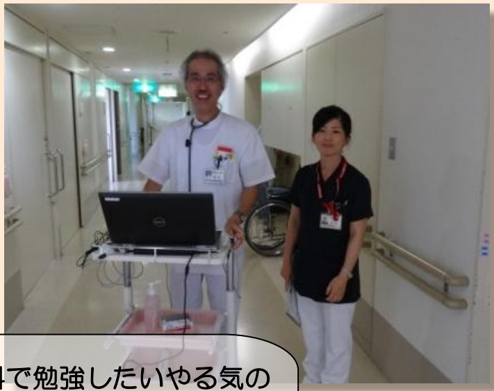
カンファレンスの風景です。治療前に各症例について検討し、より良い治療が行えるように話し合っています。